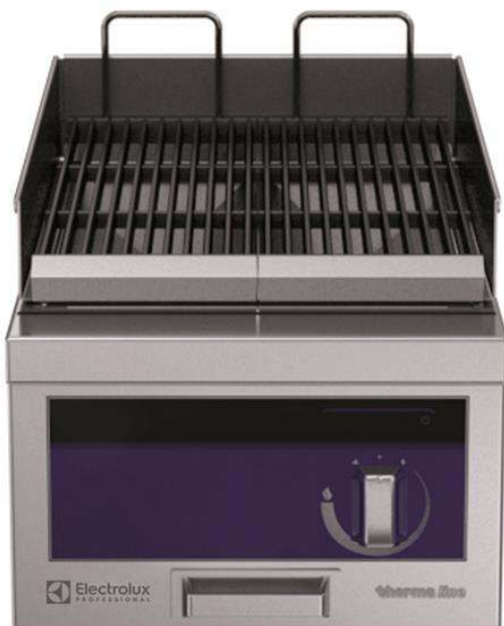
589278 (MCDAADOPO) Griglia a gas top, ½ modulo - 1 lato operatore